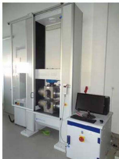
Rys. 2 Stanowisko pomiarowe